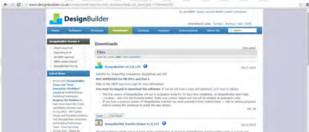
شکل (۱-۳) دانلود نرم افزار

در صفحه‌ی باز شده می‌توانید تغییرات و ویژگی‌های هر نسخه نرم افزار را مشاهده کرده و نسخه مورد نظر را دانلود کنید.