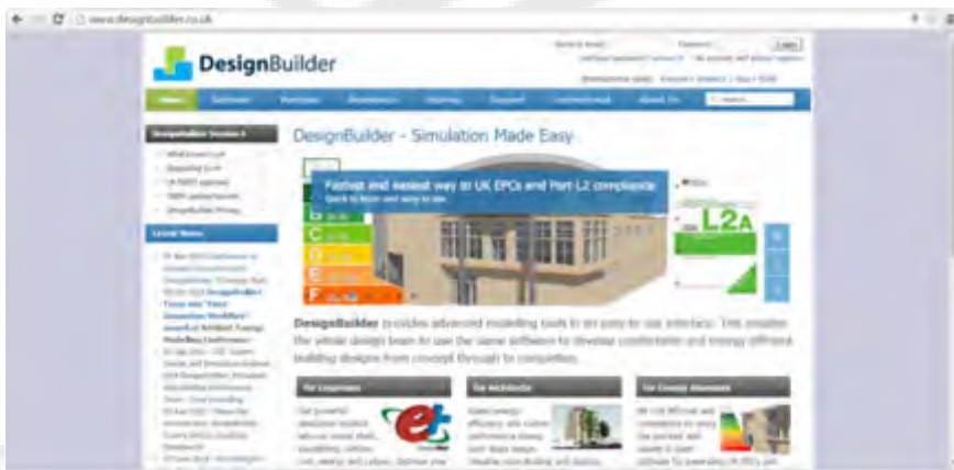
شکل (۱-۱) وب سایت نرم افزار دیزاین بیلدر

آدرس وب سایت اصلی نرم افزار دیزاین بیلدر، www.designbuilder.co.uk است. در این وب سایت شما می‌توانید آخرین نسخه نرم افزار را دانلود کنید، اطلاعات کامل در رابطه با نرم افزار را مطالعه کنید و همچنین نرم افزار و پشتیبانی مربوط به آن را ارتقا دهید. در شکل (۱-۱) صفحه‌ی اول وب سایت دیزاین بیلدر نشان داده شده است.